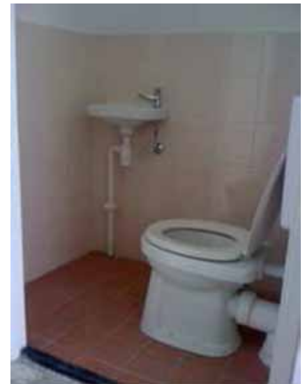
Foto: minder goed bezoekbaar toilet als gevolg van onpraktisch geplaatste pot t.o.v. de deuropening