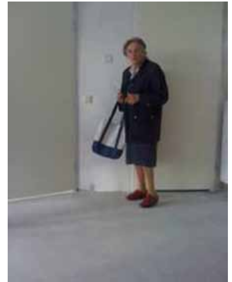
Foto: hoogte bediening van het ventilatiesysteem niet op praktische hoogte geplaatst

Voor Voorall staat dit belangrijke onderwerp al een tijdje op de agenda. Maar wat is aanpasbaar bouwen eigenlijk? Iemand die door ouderdom, ziekte of een ongeluk een hulpmiddel zoals een (elektrische) rolstoel of rollator nodig heeft, krijgt er vaak nog een probleem bij. De eigen woning blijkt hierop niet goed ingericht te zijn. Denk aan stoepjes, trappen, smalle doorgangen. Veel plaatsen in huis worden onbereikbaar. Vaak moet het hele huis verbouwd worden om te zorgen dat je nog overal kunt komen en alles kan gebruiken. Een tijdrovende en dure kwestie. Om dit te voorkomen is er aanpasbaar bouwen: bij de bouw van een woning wordt al rekening gehouden met eventuele aanpassingen in de toekomst. Het huis kan dus later relatief eenvoudig en goedkoop aan een individuele gebruiker aangepast worden. Mensen die hulpmiddelen nodig hebben, kunnen zo langer in hun eigen huis blijven wonen. Dat is fijn voor de persoon in kwestie. Bovendien leidt aanpasbaar bouwen op termijn ook tot lagere aanpassingskosten voor subsidieverstrekkers. Er bestaan inmiddels eisen voor aanpasbaar bouwen bij nieuwbouwwoningen en woongebouwen, onder andere beschreven >