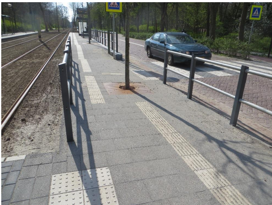
Verspringing te groot in de geleidelijn

Ook hier weer ruime halten. In de geleidelijn aan de zijde richting Centrum is een te grote verspringing waardoor de geleiding niet aansluit.