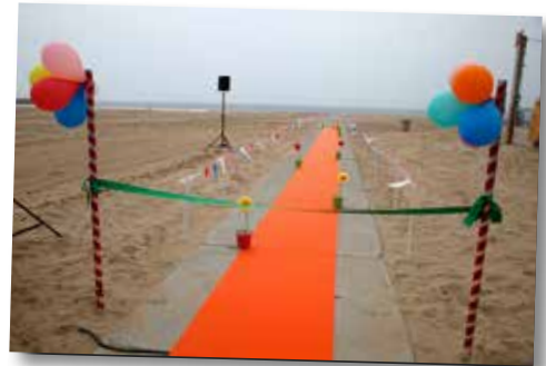
Het betonnen pad naar de zee lag er vrolijk bij