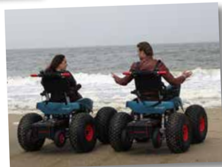
Wat een gevoel van vrijheid!