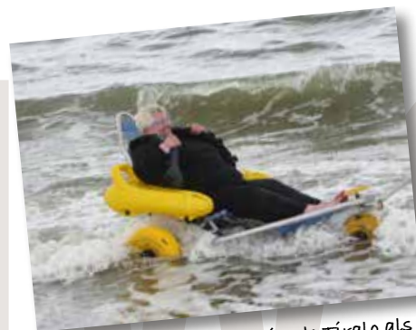
En een beetje zwemmen in de Tiralo als afsluiting. A perfect day