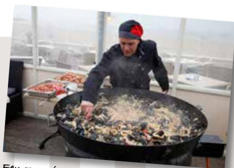
Een zonnig hapje bij de Waterreus voor extra feestvreugde