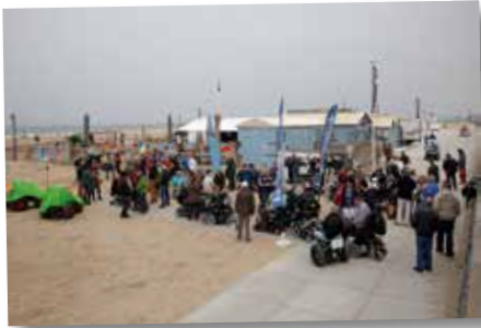
Al vroeg kwamen toeschouwers op het evenement af